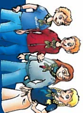
T-shirts og andre bluse-sweater- og fleecetyper m. logo

Bukser, shorts og nederdel Hovedtørklæde, spejderbælte og leder- skjorte, der forhandles af Spejder Sport. Hovedbeklædning er valgfri.